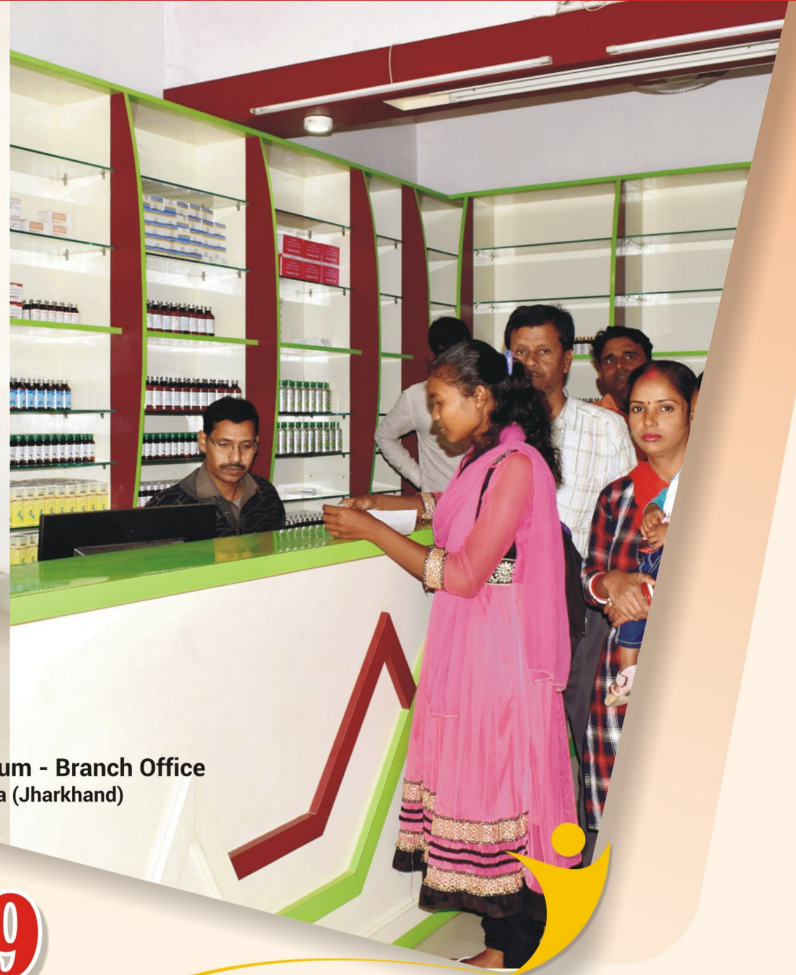
Dispensary - cum - Branch Office Ghatshila (Jharkhand)