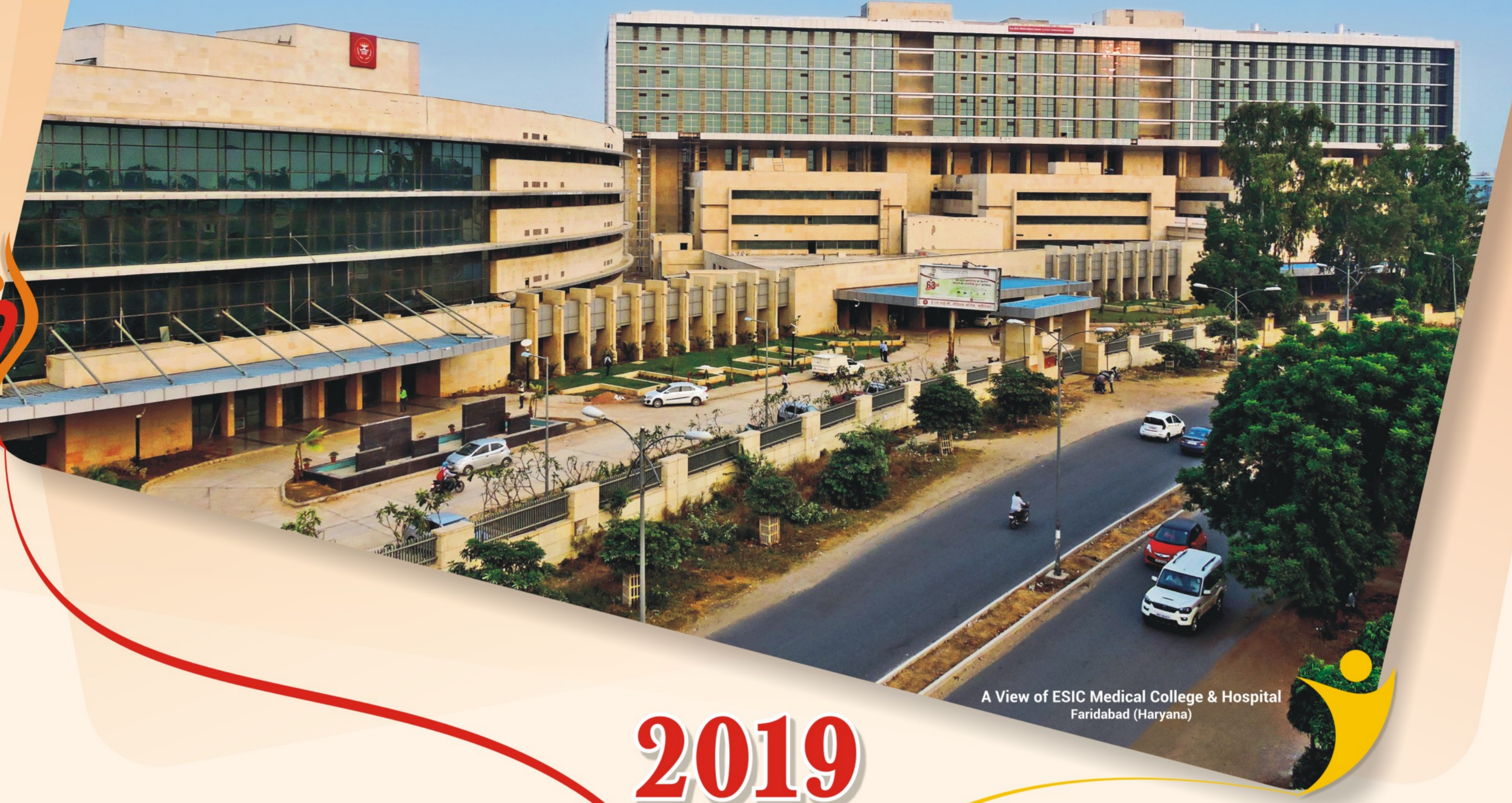
A View of ESIC Medical College & Hospital Faridabad (Haryana)