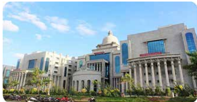
क.रा.बी.निगम चिकित्सा महाविद्यालय और अस्पताल, गुलबर्गा, कर्नाटक पाठ्यक्रम का आरंभ: 2013-14 {100 एमबीबीएस} प्रवेश संख्या में वृद्धि*: 2020-21* {125 एमबीबीएस}