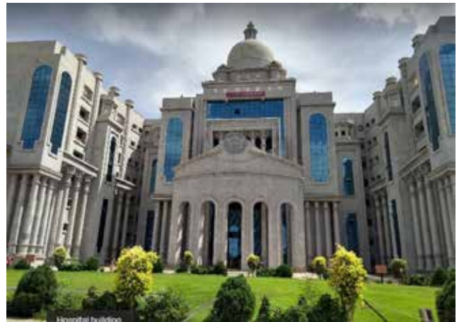
नर्सिंग महाविद्यालय, गुलबर्गा, कर्नाटक पाठ्यक्रम का आरंभ: 2015 {40 बी.एससी नर्सिंग} प्रवेश में वृद्धि*: 2020 {46 बी.एससी-नर्सिंग}