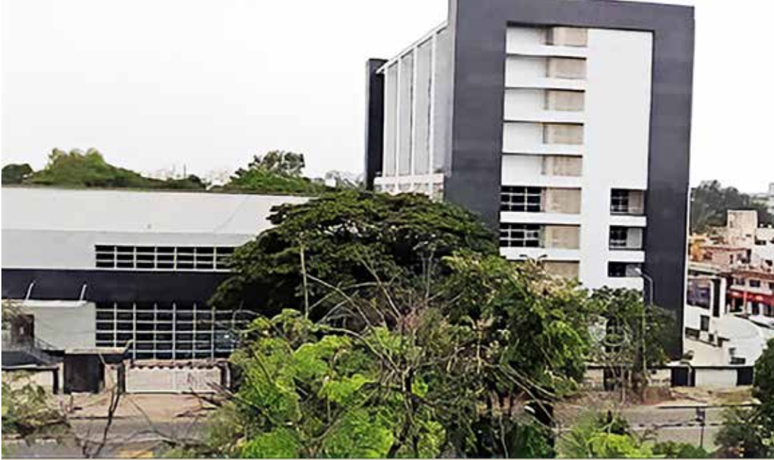
नर्सिंग महाविद्यालय, इंदिरानगर, बेंगलुरु पाठ्यक्रम का आरंभ: 2013 {40 बी.एससी नर्सिंग} प्रवेश संख्या में वृद्धि*: 2020 {46 बी.एससी-नर्सिंग}