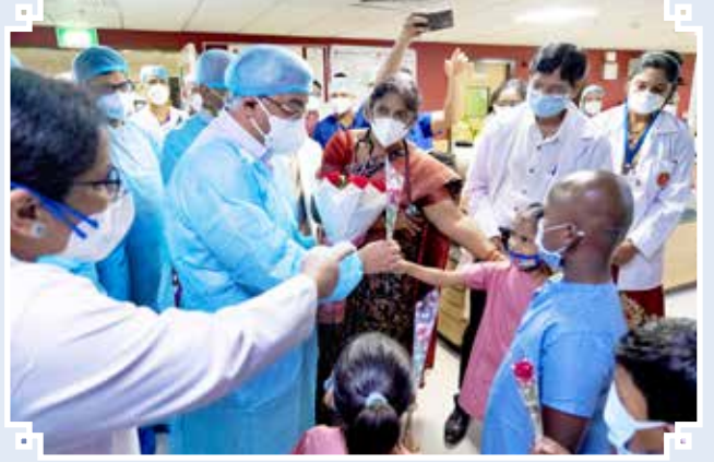
क.रा.बी.निगम अति-विशिष्टता अस्पताल, सनतनगर के वरिष्ठ चिकित्सकों की टीम कैंसर उपचार के लिए आए बच्चों से बात करते हुए।

रीनल ट्रांसप्लांट सर्जरी: पहली रीनल ट्रांसप्लांट सर्जरी नवंबर 2021 में की गई। यह किडनी रोग की अंतिम अवस्था के रोगियों के लिए एक अत्यधिक उन्नत, तकनीकी रूप से चुनौतीपूर्ण सर्जरी है। क.रा.बी. निगम सनतनगर में क.रा.बी. निगम के अति कुशल सर्जनों ने यह सर्जरी सफलतापूर्वक की। अब, यह केंद्र पूरे भारत के अधिक से अधिक मरीजों की सर्जरी करने के लिए तैयार और पूर्ण सुविधायुक्त है।