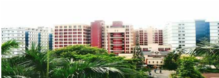
क.रा.बी.निगम चिकित्सा महाविद्यालय और अस्पताल, जोका, कोलकाता पाठ्यक्रम का आरंभ: 2013-14 {100 एमबीबीएस} प्रवेश संख्या में वृद्धि*: 2020-21* {125 एमबीबीएस}