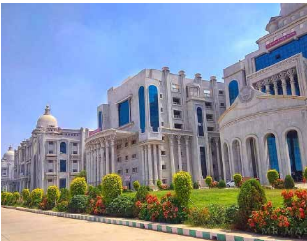
क.रा.बी.निगम दंत चिकित्सा महाविद्यालय, गुलबर्गा, कर्नाटक पाठ्यक्रम का आरंभ: 2017-18 {50 बीडीएस} प्रवेश संख्या में वृद्धि*: 2020-21* {62 बीडीएस}