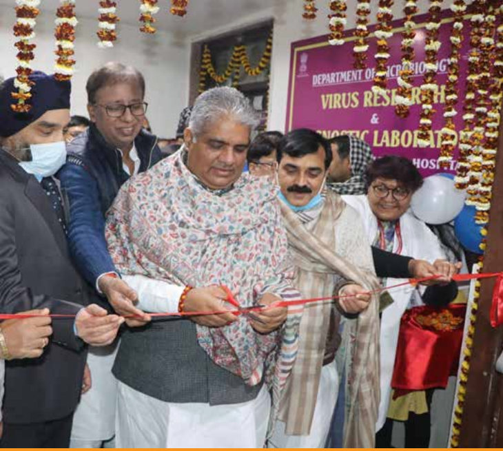
माननीय श्रम एवं रोजगार मंत्री, श्री भूपेन्द्र यादव द्वारा दिनांक 29.01.2022 को आरटी-पीसीआर का उद्घाटन