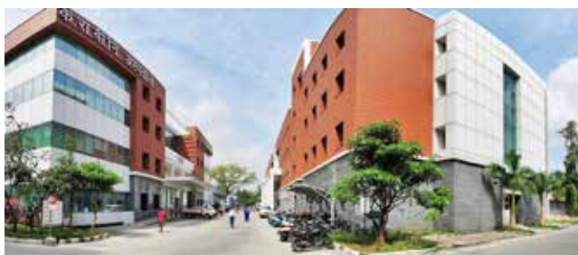
क.रा.बी.निगम चिकित्सा महाविद्यालय और अस्पताल, के.के. नगर, चेन्नई पाठ्यक्रम का आरंभ: 2013-14 {100 एमबीबीएस} प्रवेश संख्या में वृद्धि*: 2020-21* {125 एमबीबीएस}