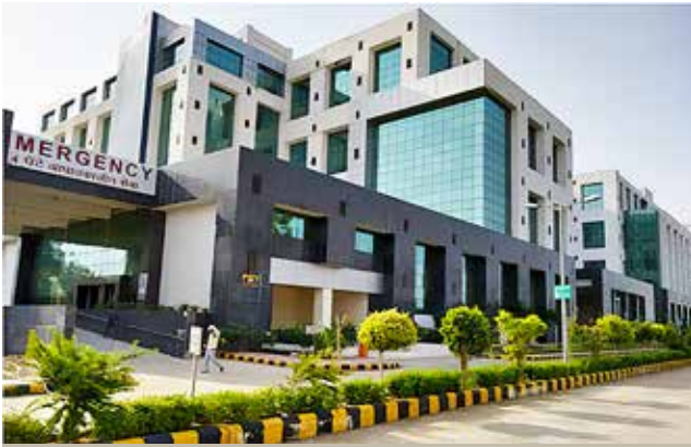
क.रा.बी.निगम चिकित्सा महाविद्यालय और अस्पताल, बिहटा-पटना, बिहार पाठ्यक्रम का आरंभ: 2021-22 {100 एमबीबीएस}