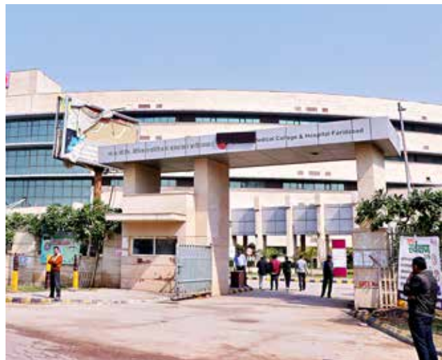
क.रा.बी.निगम चिकित्सा महाविद्यालय और अस्पताल, फरीदाबाद, हरियाणा पाठ्यक्रम का आरंभ: 2015-16 {100 एमबीबीएस} प्रवेश संख्या में वृद्धि*: 2020-21* {125 एमबीबीएस}