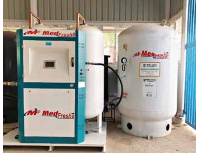
लुधियाना के क.रा.बी.निगम मॉडल अस्पताल में 1000 एलपीएम का पीएसए संयंत्र संस्थापित किया गया

अपनी मेडिकेयर सेवाओं पर गंभीर दबाव पड़ने के कारण क.रा.बी. निगम ने अनेक चुनौतियों का सामना किया। संगठन ने अपने अधिकतर अस्पतालों को कोविड संक्रमित मरीजों के उपचार के लिए समर्पित करके इस भयंकर संकट का सामना किया। संक्रमित मरीजों को राहत देने के लिए 33 क.रा.बी. निगम अस्पतालों में लगभग 4000 बिस्तर कोविड के लिए समर्पित थे। साथ ही, 400 से अधिक वेंटिलेटर लगाए गए थे। क.रा.बी. निगम अस्पतालों में लगभग 50,000 रोगियों का उपचार किया गया। इनमें न केवल क.रा.बी. के लाभार्थी बल्कि गैर-बीमाकृत व्यक्ति भी शामिल थे।