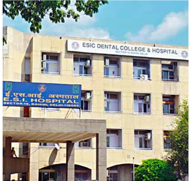
क.रा.बी.निगम दंत चिकित्सा महाविद्यालय, रोहिणी, दिल्ली पाठ्यक्रम का आरंभ: 2010-11 {50 बीडीएस} प्रवेश संख्या में वृद्धि*: 2020-21* {62 बीडीएस}