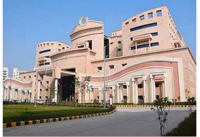
क.रा.बी.निगम चिकित्सा महाविद्यालय और अस्पताल, अलवर, राजस्थान पाठ्यक्रम का आरंभ: 2021-22 {100 एमबीबीएस}