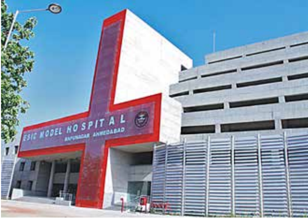
जीएनएम के लिए क.रा.बी.निगम नर्सिंग विद्यालय, बापूनगर, गुजरात पाठ्यक्रम का आरंभ: मई 2011, सीटें 20 से बढ़ाकर 22 की गईं