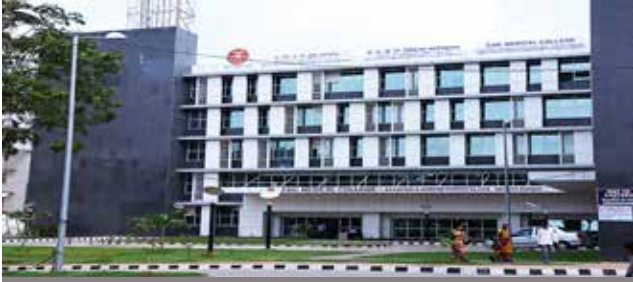
क.रा.बी.निगम चिकित्सा महाविद्यालय और अस्पताल, सनतनगर, हैदराबाद पाठ्यक्रम का आरंभ: 2016-17 {100 एमबीबीएस} प्रवेश संख्या में वृद्धि*: 2020-21* {125 एमबीबीएस}