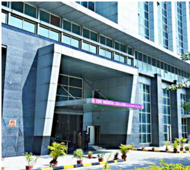
क.रा.बी.निगम चिकित्सा महाविद्यालय और अस्पताल, राजाजीनगर, बंगलूरु पाठ्यक्रम का आरंभ: 2012-13 {100 एमबीबीएस} प्रवेश संख्या में वृद्धि*: 2020-21* {125 एमबीबीएस}

क.रा.बी.निगम ने पूरे देश में शिक्षण संस्थानों की स्थापना की है ताकि स्वास्थ्य क्षेत्र के लिए बहुमूल्य मानव संसाधन का निर्माण हो सके। वर्तमान में, क.रा.बी.निगम निम्नलिखित संस्थानों का संचालन कर रहा है: