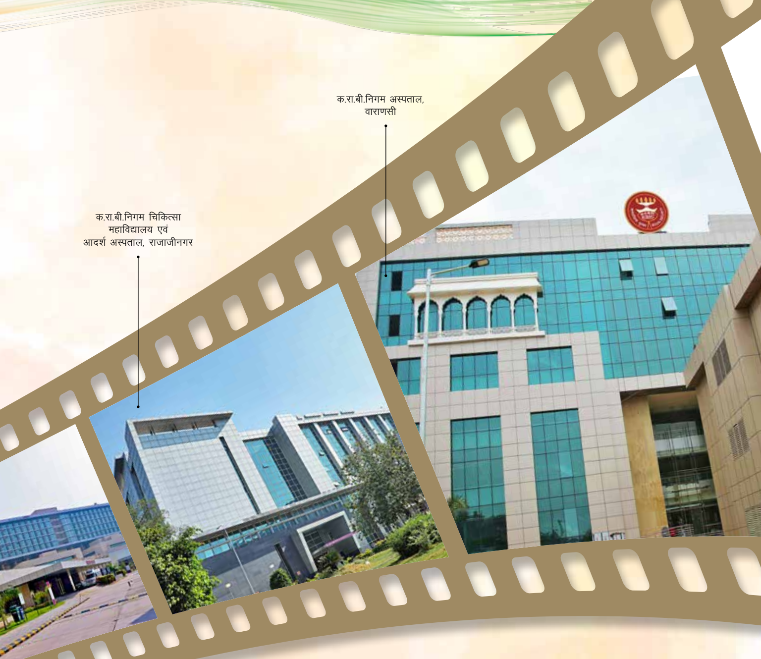
क.रा.बी.निगम चिकित्सा महाविद्यालय एवं आदर्श अस्पताल, राजाजीनगर

क.रा.बी.निगम की स्थापना वर्ष 1952 में एक सामाजिक सुरक्षा उपाय के रूप में की गई थी और इसे दुनियाभर की प्रगतिशील सरकारों द्वारा क्रियान्वित सफल स्कीमों के आधार पर अभिकल्पित किया गया था। और वर्ष 2014 से, इसने सरकारी और गैर-सरकारी क्षेत्र के आधुनिक अस्पतालों की तरह नवीनतम प्रौद्योगिकियों का प्रचलन शुरू करने के अलावा चिकित्सा महाविद्यालयों की स्थापना करके अपने क्षितिज का विस्तार करते हुए ज़बरदस्त छलांग लगाई है।